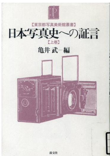
『日本写真史への証言』(上巻)

1991 年には、『日本写真史の落穂拾い』(日本写真協会) を著しました。本書は同会報 1988 年 9 月号からの連載 15 回分をまとめたものです。明治元年から 15 年までの新聞に掲載された写真関係の記事と広告を基に、御真影、水出し写真、幻燈、写真師に関するエピソードなど、写真に関する細かい話題 65 項目を随筆調に読みやすくまとめています。本書刊行後も 1995 年 4 月の 375 号まで全 35 回連載されたのち、『カメラレビュー クラシックカメラ専科』36 号 (1995 年 12 月) から 17 回にわたって継続連載され、59 号 (2001 年 5 月) の「明治初期の九州地方の写真界」が、未完のまま遺稿となりました。